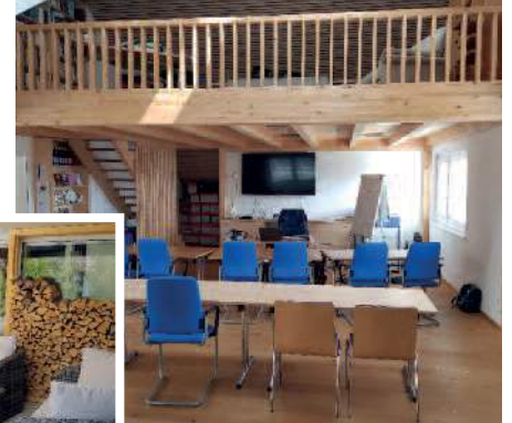
Schulungsbereich in Eschen

Die Seminare finden in Eschen (FL) in den Kursräumen des Naturheilzentrums in kleinen Gruppen bis maximal 12 Teilnehmer statt. Dadurch haben die Referenten genug Zeit, um auf die Fragen der Teilnehmer einzugehen.