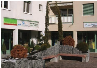
Naturheilzentrum in Eschen