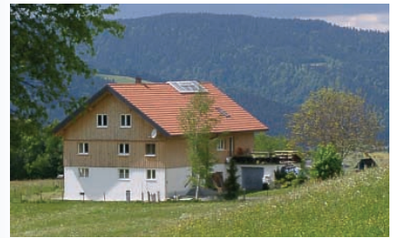
Seminarhaus in Sulzberg