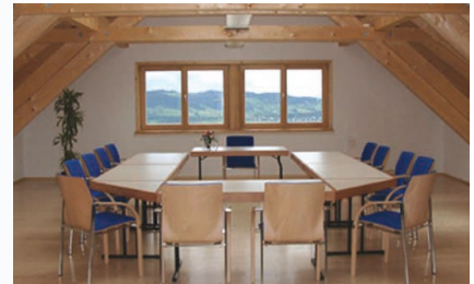
Seminarraum im Seminarzentrum