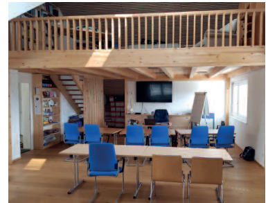
Schulungsraum in Eschen