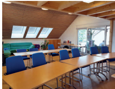
Schulungsraum in Eschen

Die Seminare finden in Eschen (FL) in den Kursräumen des Naturheilzentrums statt. Wir freuen uns auf Ihren Besuch.